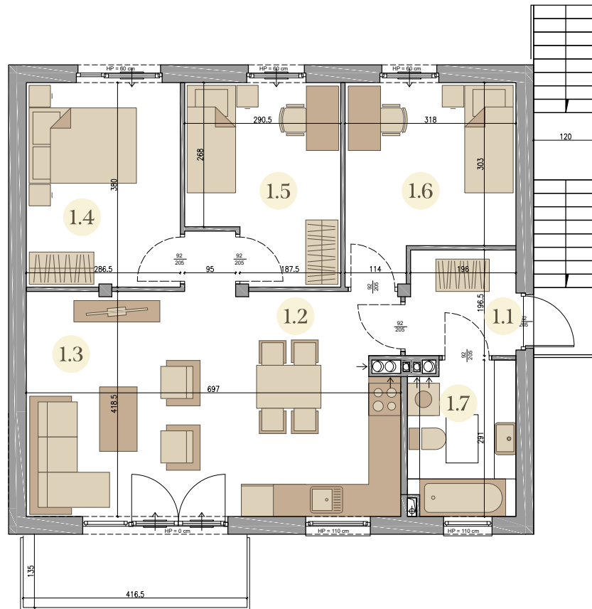
rzut osiedla ul. Kwiatowa